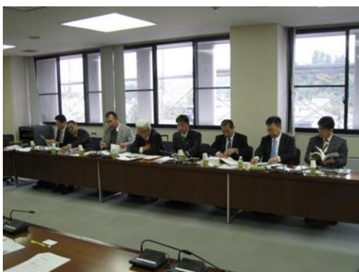
篠山市において説明を聞く委員

本市にも多くの歴史資源が存在していますことから、早期に体系的に整理、情報化し、地域ごとに再点検、再発掘する必要性を感じました。