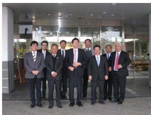
篠山市庁舎前にて