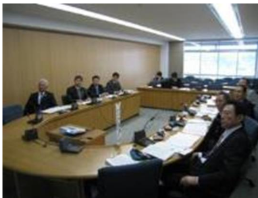
説明を受ける委員