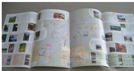
市内文化財の紹介パンフレット