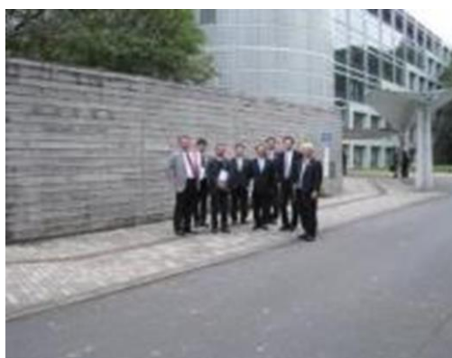
掛川市庁舎前にて